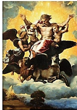
Oorsprong en toekomst van de mens